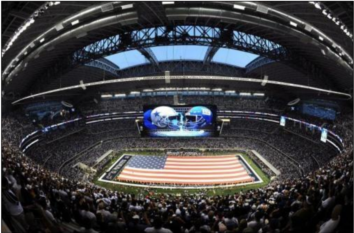
Neues Dallas Cowboys Stadium